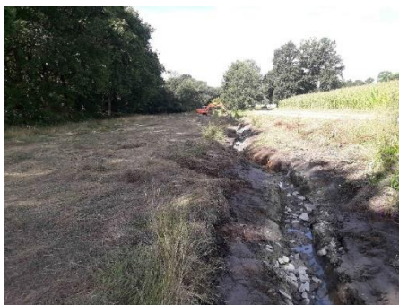
Remise dans le fond de vallée d'un cours d'eau à Montreuil-sur-Ille