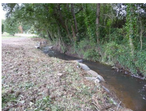
Retalutage des berges à Gévezé