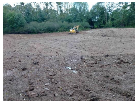
Création d'une frayère à brochets à Betton