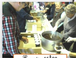
Animation continue musique, chant et danse