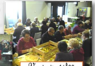
Vendredi 14h00 épluchage des pommes