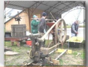
Vendredi 14h00 Fabrication du jus de pommes