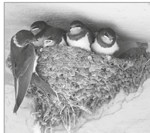
De gauche à droite : Martinet, Hirondelle, nid d'Hirondelles