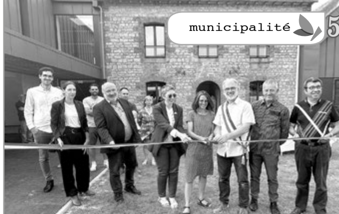
Inauguration du Centre de Loisirs, le 27 juin 2024

Malgré la crise des matières premières, malgré la crise des coûts de l'énergie qui nous impacte fortement, malgré les façades qui menacent de s'écrouler, le résultat est là et vous passez tous les jours devant.