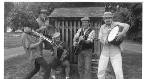
Le groupe DANS' MEIZE

Prochain bœuf : vendredi 19 décembre 2014